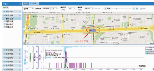
图3 基于模型的防汛调度系统

① 对于城市排水管网,通过建立相应的管网模型,在水文信息、降雨情况和气象信息以及城市地理信息的基础上,对不同降雨强度下的城市内涝、积水状况进行定量、可视化的分析,对汛情做出及时预警,并辅助水务部门做出合理的调度预案 [3] 。基于管网模型的城市防汛调度系统如图 3 所示。