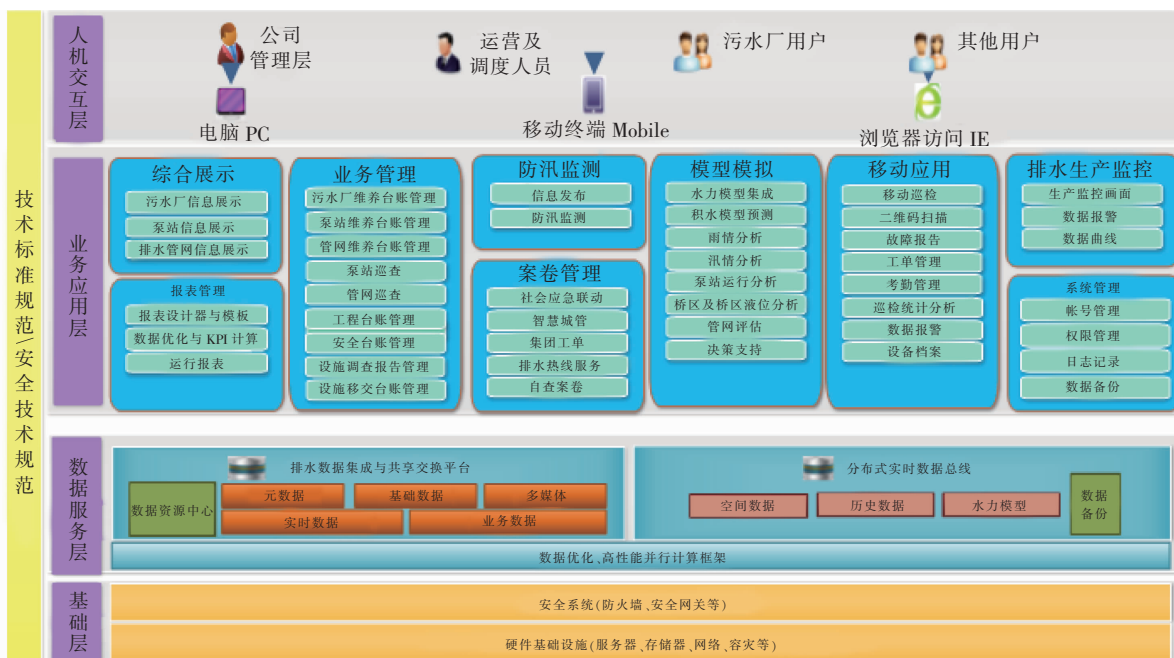
图2 智慧排水系统总体框架

智慧排水总体框架包括基础层、数据服务层、业务应用层和人机交互层四层结构 [2] ,具体见图2。